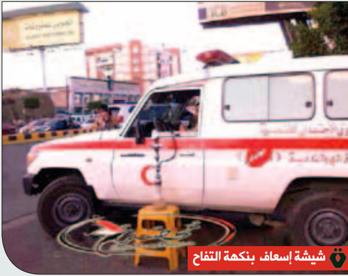
شيشة إسعاف بنكهة التفاح