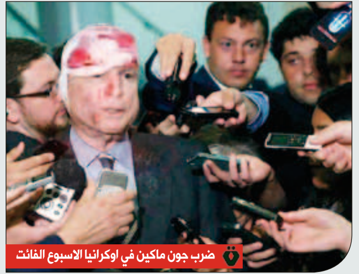
ضرب جون ماكين في اوكرانيا الاسبوع الفائت