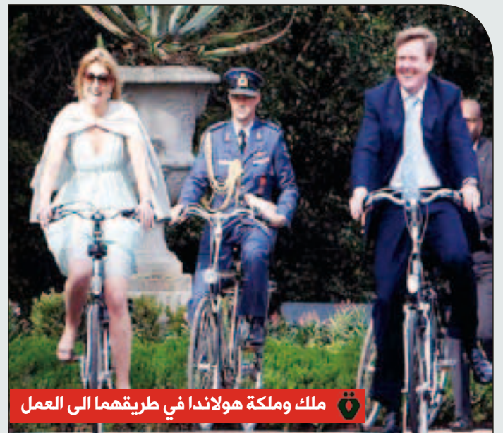
ملك ومملكة هولاندا في طريقهما الى العمل