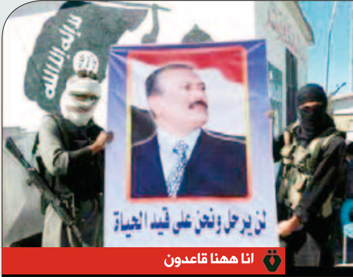
أنا ههنا قاعدون