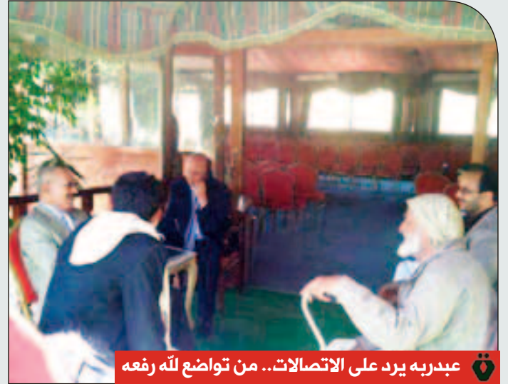
عبدربه يرد على الاتصالات.. من تواضع لله رفعه