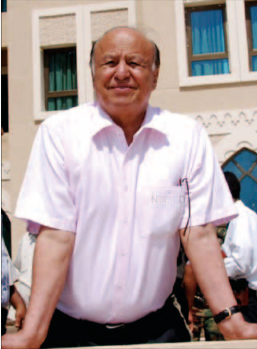
بصورة خفية سوف يخرجون إلى العلن ويتسيدون الموقف، ولن يجدوا أنفسهم مضطرين للمواربة والتخفي خلف الإدانات الإعلامية كما يفعلون

إنها خسارة جمعية رهيبة.. ليس ثمة مستفيد واحد من اغتيال الرئيس حتى وإن ظن البعض ذلك في اللحظة الراهنة.. سوف يدفع الجميع الثمن، سواء على الصعيد السياسي أو الحزبي أو الاقتصادي أو المجتمعي، وحتى على الصعيد الشخصي! إذ أن انسداد الأفق السياسي بهذه الصورة سيفتح الباب على مصراعيه أمام أمراء الحروب وزعماء القتل وتجار الدماء؛ وبدلاً من ممارساتهم المعهودة هو أياتهم الدموية