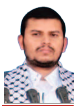
زعيم الصرخة القائلة!