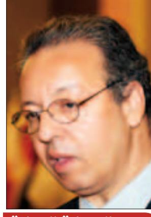
زعيم الوصاية الدولية