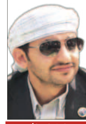
زعيم مليشيات الحروب!