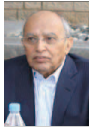
زعيم العزل والاعتزال